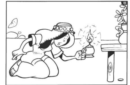
het verloren muntje