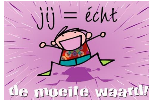
Jij bent de moeite waard!