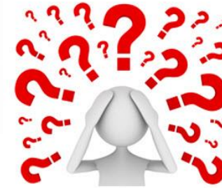
veld vol vragen