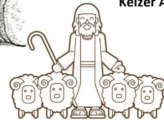
herders in het veld

LAATSTE VRAAG! Als je goed hebt opgelet bij de preek, weet je nu wat het antwoord van God is op al je vragen! Het antwoord =