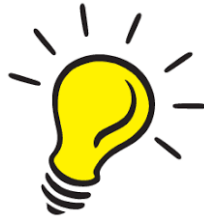
Lichtje aan de horizon

TEKENEN! Het is kerstfeest! Laten we er dus een feestje van maken. Teken op de achterkant de meest feestelijke kerstboom die jij je kunt voorstellen.